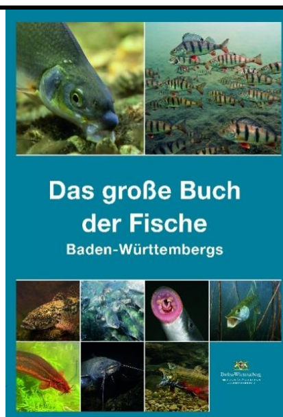
Das große Buch der Fische Baden-Württembergs 21 x 29,7 cm, Hardcover, 372 Seiten.

Herausgeber: Ministerium für Ländlichen Raum und Verbraucherschutz Baden-Württemberg.