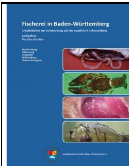
Arbeitsblätter Fischkrankheiten , 44 Seiten, Herausgeber Landesfischereiverband BW

Die Broschüre bietet einen komprimierten Überblick über die Krankheiten der Fische. Sie behandelt nur die wichtigsten Krankheiten unserer heimischen Fische und die Bereiche, die als Prüfungsstoff der Fischerprüfung Baden-Württembergs in Frage kommen. Sie soll kein erschöpfendes Nachschlagewerk zu den Fischkrankheiten sein und vermittelt in dieser Hinsicht absichtlich nur begrenztes Wissen, um dieses Heft für den Fischerei-Neuling nicht mit Information zu überfrachten und ein zügiges Lernen zu unterstützen.