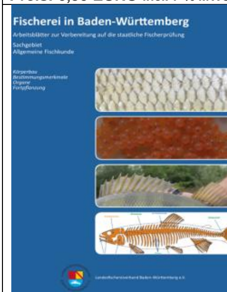
Arbeitsblätter Allgemeine Fischkunde , 60 Seiten Herausgeber: Landesfischereiverband BW

Die Broschüre "Allgemeine Fischkunde" behandelt Themenbereiche wie z.B. Funktion, Aufbau und Form des Fischkörpers sowie Aspekte zur Fortpflanzung. Das vermittelte Wissen ist Grundlage für das Verständnis der Lebensraumsansprüche der verschiedenen Arten in unseren Gewässern, sowie den fachgerechten Umgang mit Fischen. Der Inhalt der Broschüre beschränkt sich im Wesentlichen auf den Prüfungsstoff der Fischerprüfung in BW.