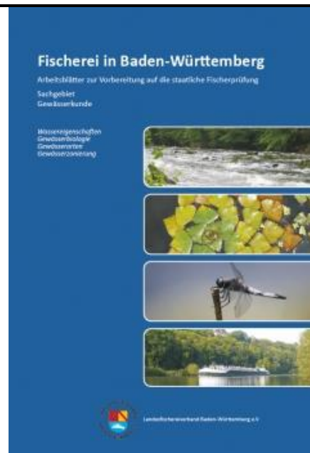
Arbeitsblätter Gewässerkunde , 92 Seiten, Herausgeber: Landesfischereiverband BW

Die Broschüre bietet einen Überblick über die Gewässerkunde. Sie soll kein erschöpfendes Nachschlagewerk sein und bietet in dieser Hinsicht absichtlich nur begrenzte Information. Die Broschüre behandelt die Bereiche der Gewässerkunde, die als Prüfungsstoff in der Fischerprüfung in BW in Frage kommen. Es wurden absichtlich thematische Beschränkungen vorgenommen, um ein zügiges Lernen zu unterstützen.