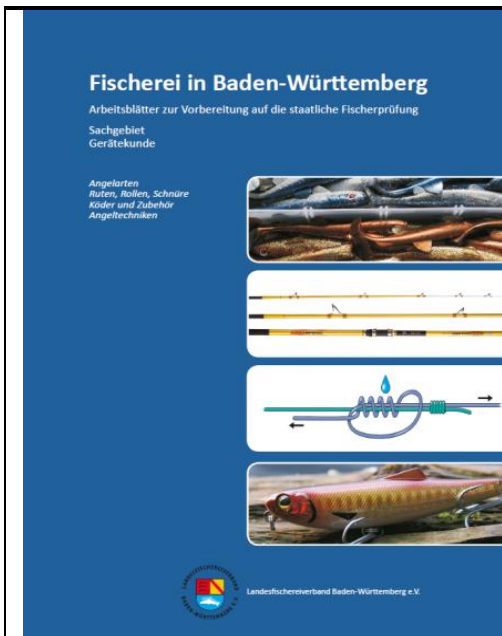
Arbeitsblätter Gerätekunde , 72 Seiten, Herausgeber: Landesfischereiverband BW

Die Broschüre bietet einen sehr guten Einblick in die Welt der Angelgeräte. Thematisch sortiert und durch zahlreiche Grafiken unterstützt wird hier der Prüfling bestens auf den Fachbereich Gerätekunde vorbereitet. Dieses Heft eignet sich sowohl zur Vorbereitung auf die Fischerprüfung wie auch als Nachschlagewerk nach erfolgreich abgeschlossener Prüfung.