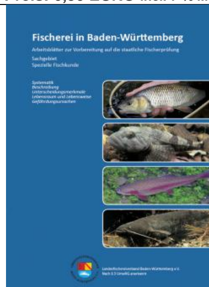
Arbeitsblätter Spezielle Fischkunde , 80 Seiten Herausgeber Landesfischereiverband BW

Die Broschüre bietet einen komprimierten Überblick über die spezielle Fischkunde. Sie soll kein erschöpfendes Nachschlagewerk zur Fischkunde oder zur Situation heimischer Fischbestände sein und bietet in dieser Hinsicht absichtlich nur begrenzte Information. Sie bietet Informationen über die wichtigsten heimischen Fischarten und behandelt dabei die Bereiche der speziellen Fischkunde, die als Prüfungsstoff in der Fischerprüfung Baden-Württembergs in Frage kommen. Es wurden absichtlich thematische Beschränkungen vorgenommen, um ein zügiges Lernen zu unterstützen.