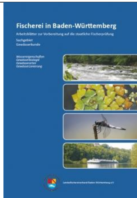
Arbeitsblätter Gewässerkunde, 92 Seiten, Herausgeber: Landesfischereiverband BW

Die Broschüre bietet einen Überblick über die Gewässerkunde. Sie soll kein erschöpfendes Nachschlagewerk sein und bietet in dieser Hinsicht absichtlich nur begrenzte Information. Die Broschüre behandelt die Bereiche der Gewässerkunde, die als Prüfungsstoff in der Fischerprüfung in BW in Frage kommen. Es wurden absichtlich thematische Beschränkungen vorgenommen, um ein zügiges Lernen zu unterstützen.