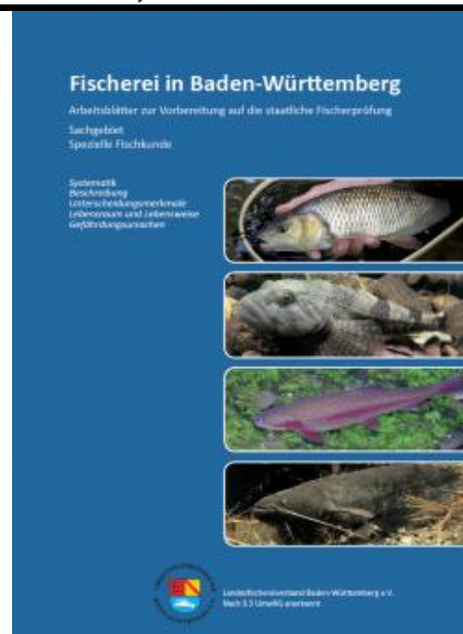
Arbeitsblätter Spezielle Fischkunde, 80 Seiten Herausgeber Landesfischereiverband BW

Die Broschüre bietet einen komprimierten Überblick über die spezielle Fischkunde. Sie soll kein erschöpfendes Nachschlagewerk zur Fischkunde oder zur Situation heimischer Fischbestände sein und bietet in dieser Hinsicht absichtlich nur begrenzte Information. Sie bietet Informationen über die wichtigsten heimischen Fischarten und behandelt dabei die Bereiche der speziellen Fischkunde, die als Prüfungsstoff in der Fischerprüfung Baden-Württembergs in Frage kommen. Es wurden absichtlich thematische Beschränkungen vorgenommen, um ein zügiges Lernen zu unterstützen.