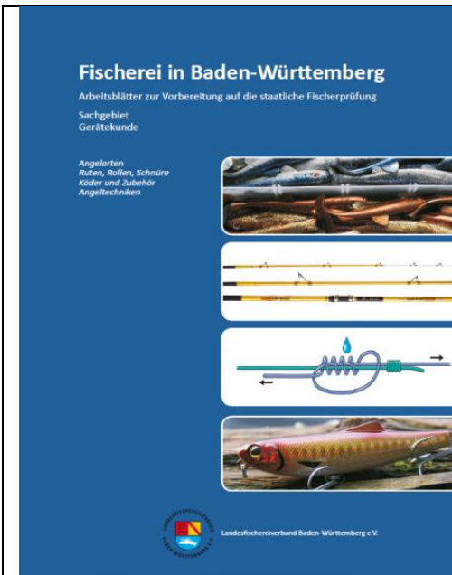
Arbeitsblätter Gerätekunde, 72 Seiten, Herausgeber: Landesfischereiverband BW

Die Broschüre bietet einen sehr guten Einblick in die Welt der Angelgeräte. Thematisch sortiert und durch zahlreiche Grafiken unterstützt wird hier der Prüfling bestens auf den Fachbereich Gerätekunde vorbereitet. Dieses Heft eignet sich sowohl zur Vorbereitung auf die Fischerprüfung wie auch als Nachschlagewerk nach erfolgreich abgeschlossener Prüfung.